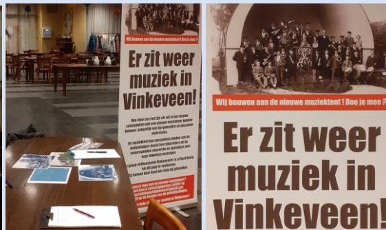
Links: de goed gevulde sportzaal bij het Concordia jubileumconcert. Rechts: inschrijfplek voor nieuwsbrief 'Walnoot' (een uitgebreide terugblik op de diverse muziektenten van Vinkeveen komt in het decembernummer van onze Proosdijkroniek)